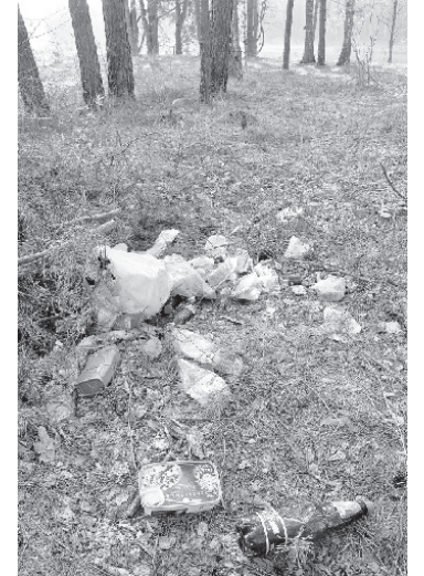
Lūk, kāda ir cilvēku „pateicība”