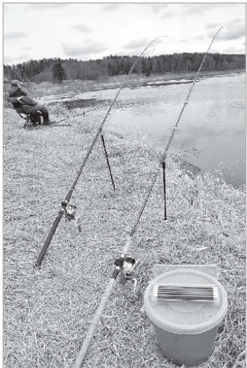
Zvejnieku prieku krasts

Makšķerēšana, pirmkārt, ir sapņošana klusumā, ūdens vērošana novērš no visām pasaulīgajām domām. Tieši tāpēc mēs