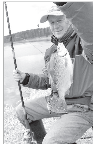
Pirmā upes rauda.

palīdzēt dabai. Zilo ezeru zeme bez zivīm - tāda ir atmaksa par mūsu divdesmit gadus ilgo bezrūpību. Un mēs atrodamies tik