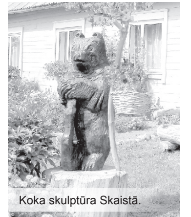
Koka skulptūra Skaistā.