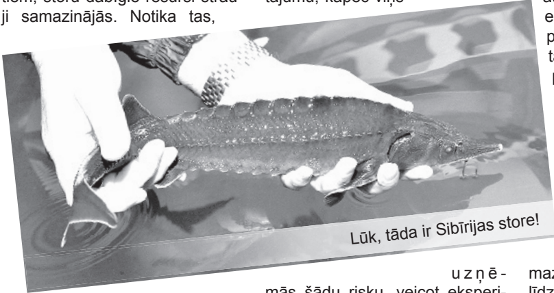
Lūk, tāda ir Sibīrijas store!

Kas iznīcināja šo unikālo zivi? Pirmkārt, zivs gastronomiskā kvalitāte, kas jau sen tiek dēvēta par karalisku. No stores gaļas tiek pagatavotas dārgas delikateses, vēl vērtīgāki ir melnie ikrī. Zivs gaļa tiek pieprasīta svaigā, saldētā, sālītā, vītinātā un kūpinātā veidā. Te arī rodas neierobežotais zvejnieku-sagādnieku spiediens. Otrkārt, kad cilvēki Kaspijas, Azovas un Melnās jūras upju baseinus sāka ierobežot ar hidroelektrostaciju aizsprostiem, storu dabīgie resursi strauji samazinājās. Notika tas,