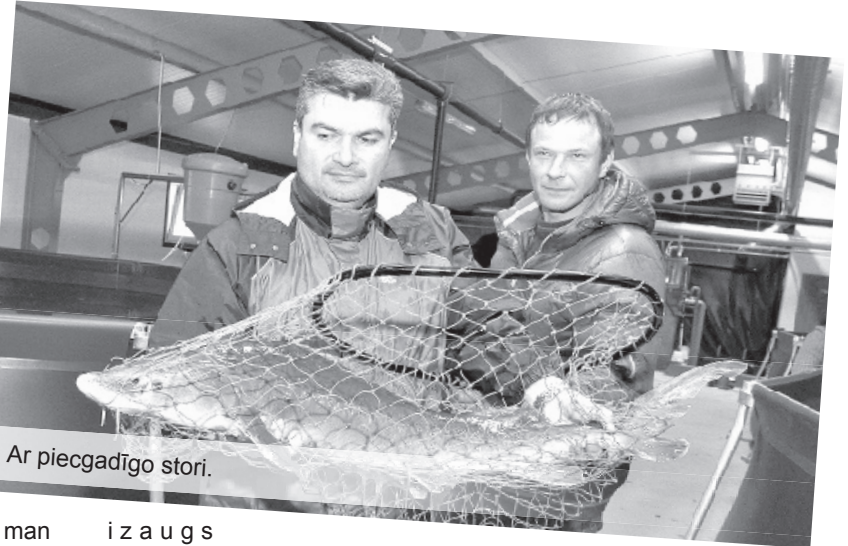
Ar piecgadīgo stori.

Viesmīlīgais saimnieks parādīja man pašreizējo ražošanu, pastāstīja, kā automātiski tiek kontrolēts skābekļa daudzums ūdenī un uzturēts attīrīšanas režīms. Barošana – arī automātisks režīms. Interesanti, ka pirmā dzīves gada laikā mākslīgos apstākļos ar sauso barību zivju mazuļi