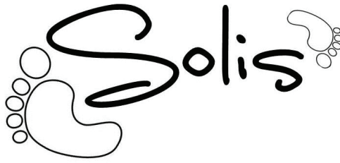
Alekseja GONČAROVA foto