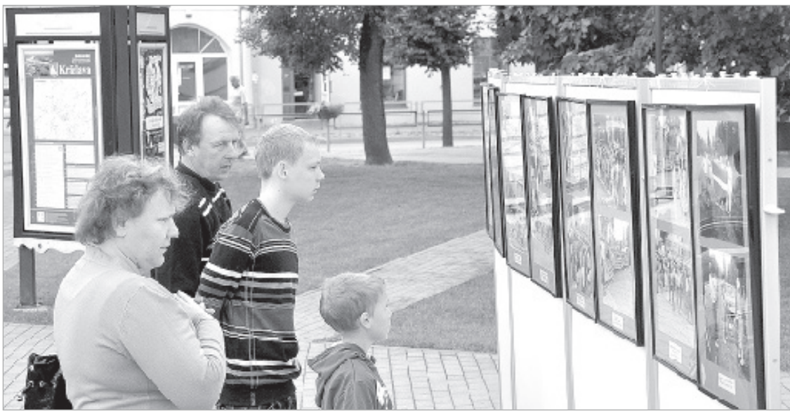
23. augustā, Baltijas ceļa 25. gadadienā, Krāslavas Vēstures un mākslas muzejs pilsētas laukumā organizēja ekspres izstādi. Notikumu hronika fotogrāfijās izraisīja garāmgājēju interesi. Par pasākumu lasiet nākamajā "Ezerzemes" numurā.