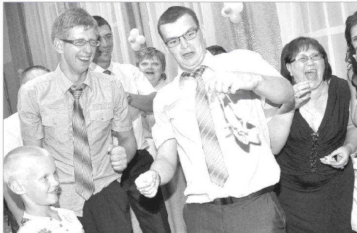
Stringi - ne tam adresēti