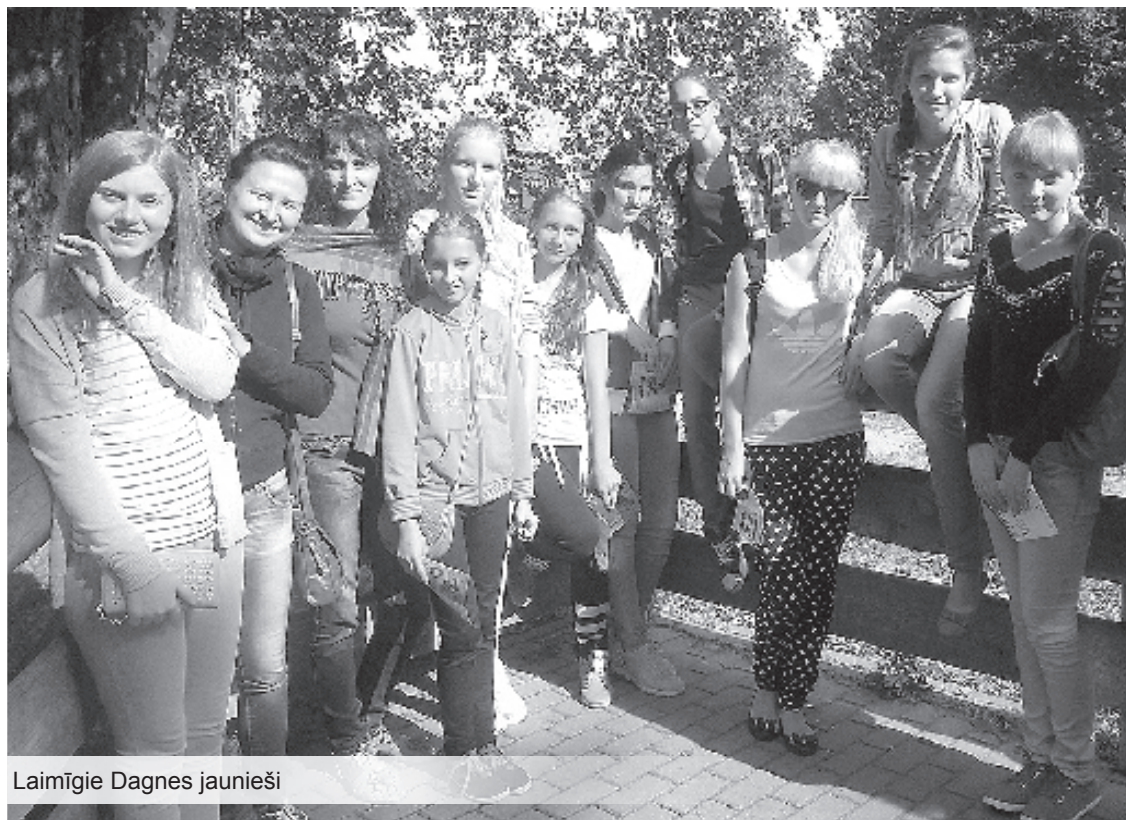
Laimīgie Dagnes jaunieši