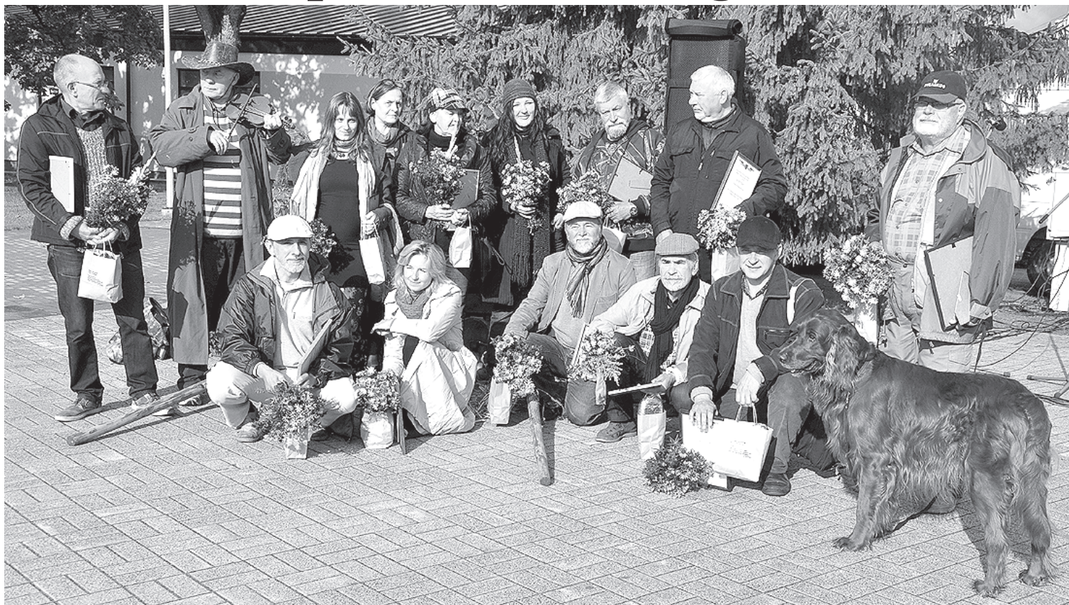
Starptautiskā mākslinieku rudens plenēra Krāslavā atvadu foto. Vairāk informācijas lasiet nākamajā "Ezerzemes" numurā.