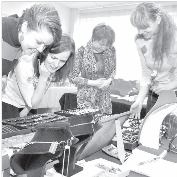
Krāslava. Ziemassvētku tirdziņš.