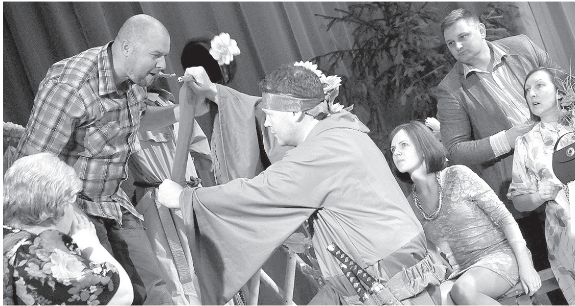
Pilna skatītāju zāle, pirmizrāde, ziedu jūra... Vairāk par Krāslavas Kultūras nama amatiereteātra pirmizrādi lasiet nākamajā "Ezerzemes" numurā.