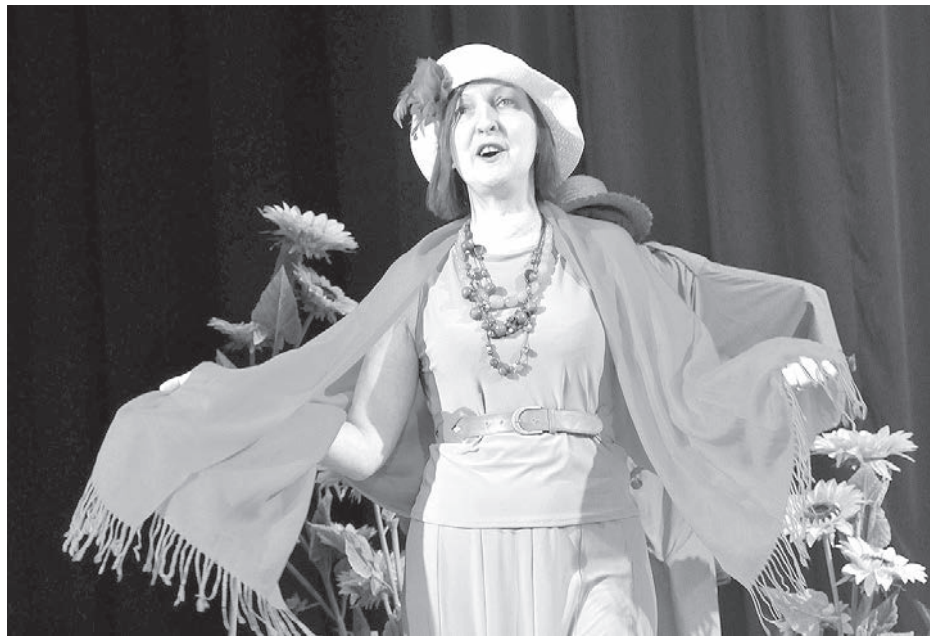
Ainas no izrādes „Visi radi kopā”