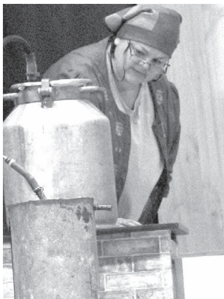
izrādē „Sievasmātes bizness”