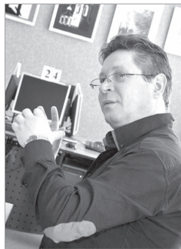
tālākizglītības kursu lektors.