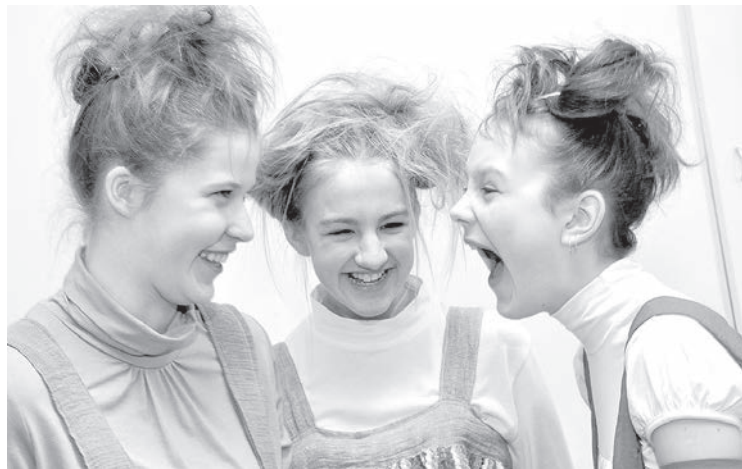
1. aprīļa joks.