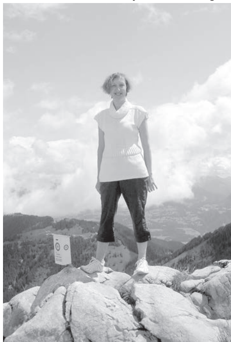
Janīna Austrijas Alpos.

Tāpat kā daudzi jaunlaulātie Samsanoviči no sākuma mitinājās skolotāju kopmītnē, kas atradās renovētajā ēkā, kurā tagad