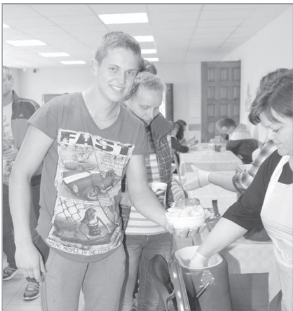
Pusdienas pēc plāna.