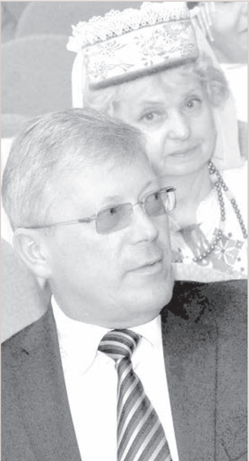
Ģenerālkonsuls Vladimirs Klimovs.