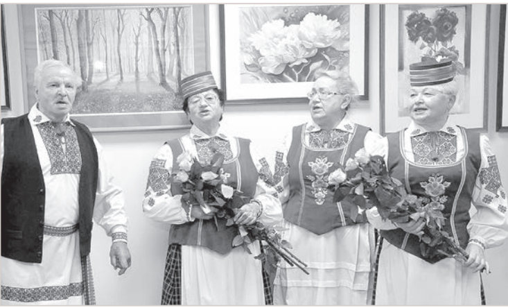
Uzstājas ansamblis "Kutok".