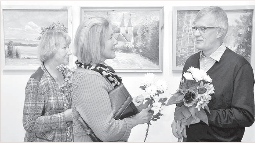
Rudens krizantēmas - no draugiem.

Kā Vjačeslavam izdodas visur paspēt? Turklāt pirms pieciem se-