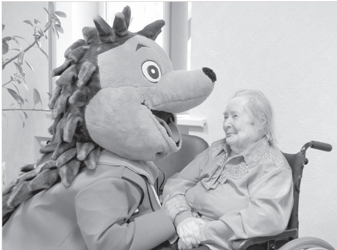
Tuvojoties Veco ļaužu dienai, pensionāta "Priedes" iedzīvotājus apciemoja Ezis, kas ikvienam no tur mītošajiem veltīja mirkli uzmanības un stipru veselību. Katram no mums ir iespēja radīt prieku apkārtējiem!