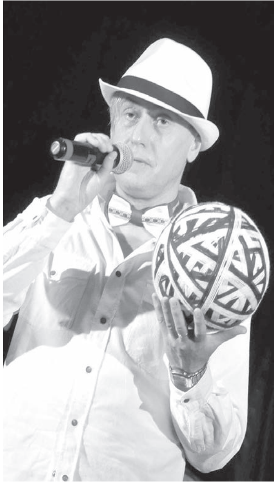
Īpašais viesis - dzejnieks Jānis Baltjancis.