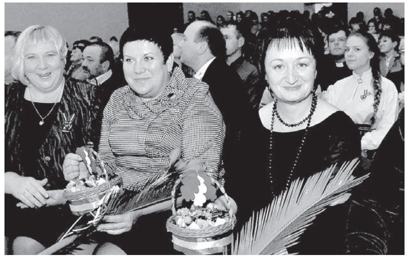
Uzaicināto viesu vidū - sadarbības partneri no Verhņedvinskas.