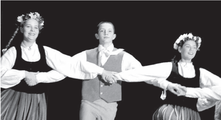
Lielā svētku koncerta fragments.