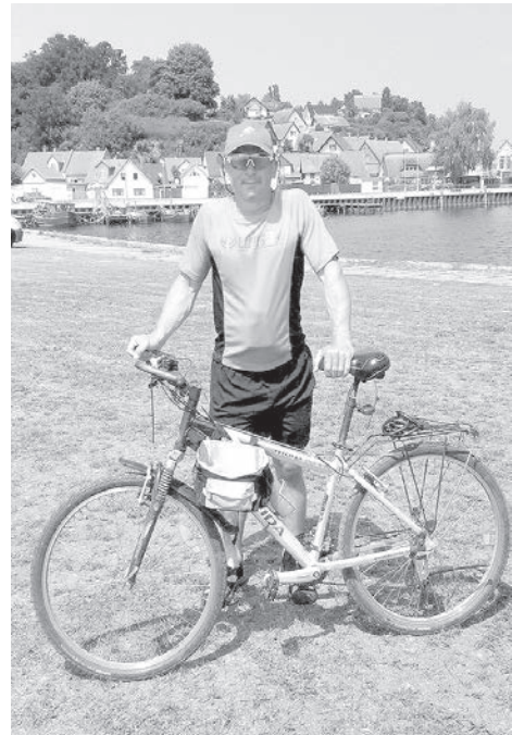
Ezera krastā - Ščecina.