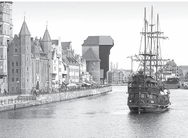
Gdaņska - ostas pilsēta.