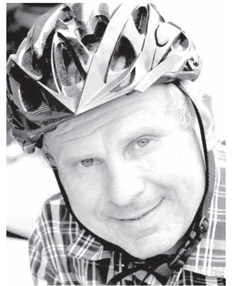
Viens pats velosipēdists.