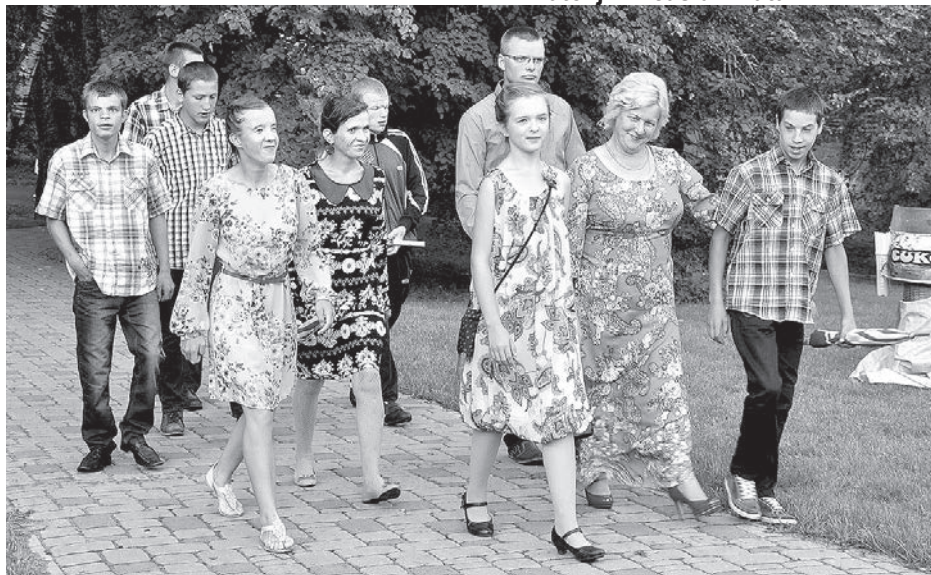
Svinēt svētkus - ar visu ģimeni.