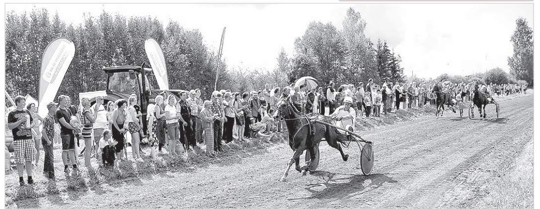
Viens no desmit braucieniem.

Fortūna strauji pagriezās ar seju uz ārzemju viesu