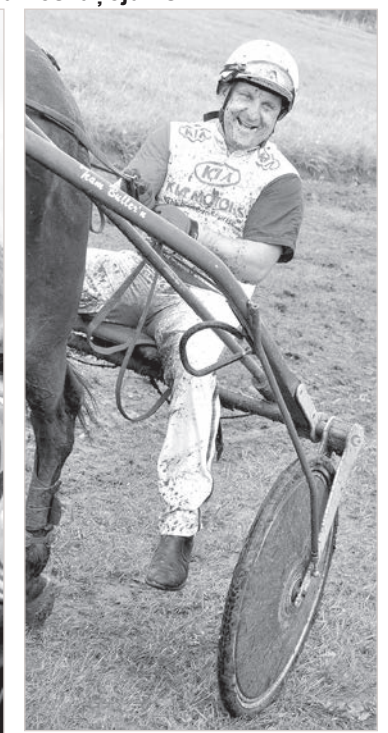
Lietuva - ārpus konkurencēs!