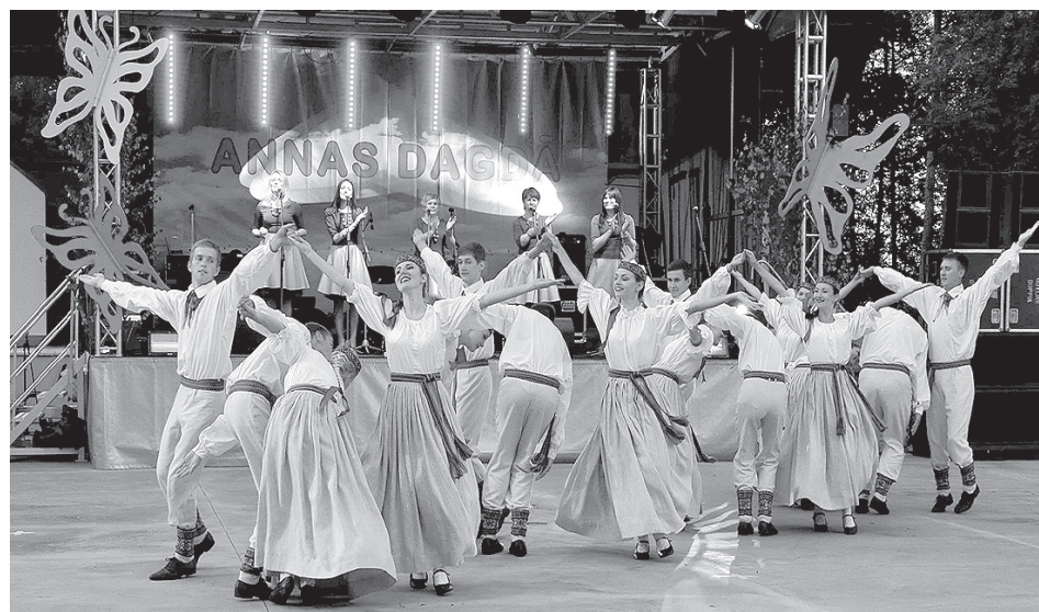
Tautas deju ansamblis "Dagda".

murs. Skatītāji neželēja savas plaukstas, bija dzirdami arī "bravo!" saucieni. Novada radošo panākumu parādi turpināja vietējās baltkrievu biedrības kolektīvs "Akolica", par ko milzīgs paldis ansambļa vadītājam Ta-