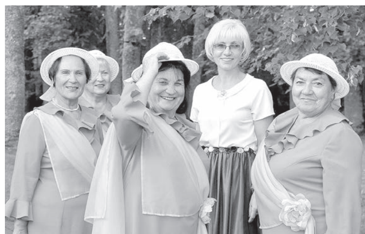
"Ezeriņi" pēc veiksmīgas uzstāšanās.

Dagdā parkā šoreiz bija maz vietas. Daudzi pilsētas un lauku iedzīvotāji ieradās uz šiem sengaidītajiem svētkiem ar visu ģimeni. Tika piedāvātas gan dažādas izklaides, gan plašs tirgotāju preču klāsts. Un dejas līdz rītausmai, jo grupas "Kā gribat" muzikanti pilnībā attaisnoja savu nosaukumu. Bet mākoņi, kas gan klīda apkārt, gandrīz netraucēja vispā-