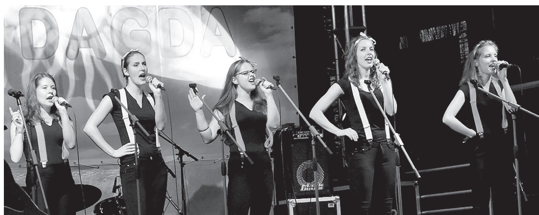
Uz skatuves Ezernieku "Gamma".