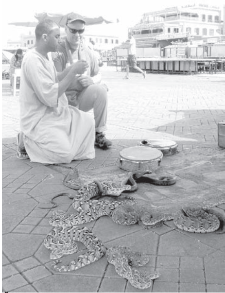
Cūsku didītājs Marakešā.