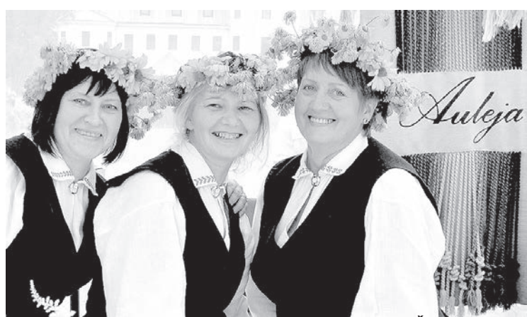
Svētku gadatirgus Krāslavā.