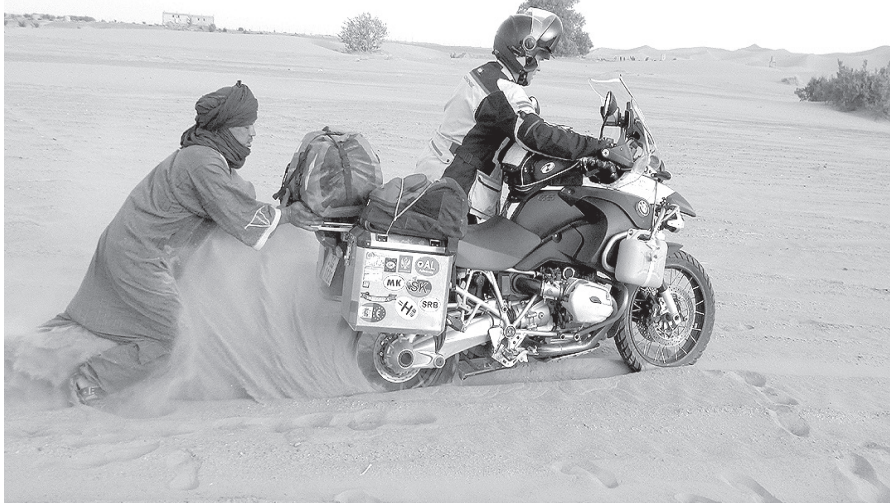
Gadījās arī tā: pilnīgs draivs!

Maija nesē ar motociklu apceļojām Sahāru. Vai tas jūs interesē?"