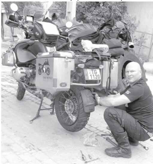
Melnais kontinents: riepu maiņa.

Vēl viens Marokas brīnums – Marakešas pilsēta. Liels centrālais laukums pārvēršas par milzīgu teātri, kur valda ielu muzikanti, mākslinieki, faķīri. Un visi šie prieki - par nelielu samaksu, pēc mūsu standartiem - simbolisku. Bet cūsku didītājus varēja ieraudzīt tikai pēc rītausmas, jo kobras, klamburcūskas un citi rāpuļi naktī var aizrāpot. Katram