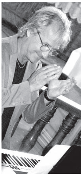
klātesošos: "...Koncerts šodien notiek svētā