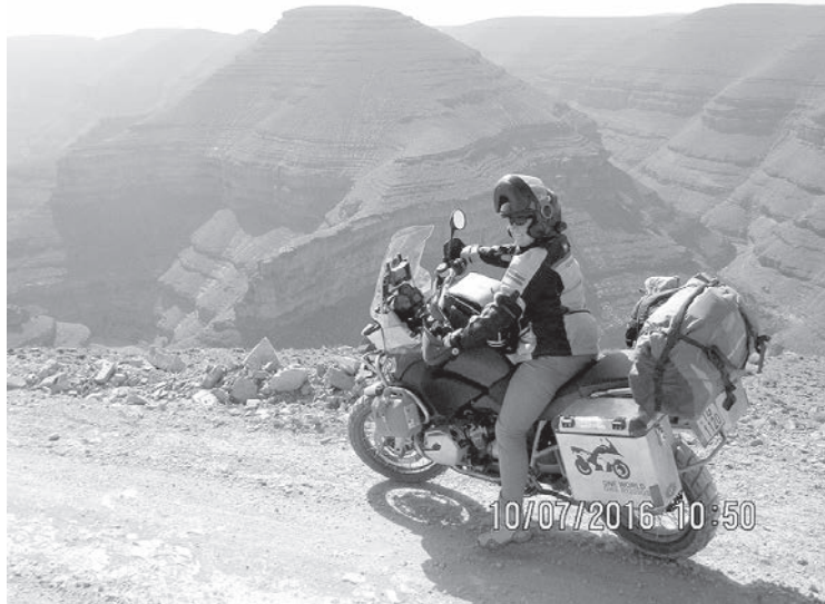
Virsošnes iekarošana 10.jūlijā.

didītājam - trīs-četri desmiti čūsku, kas ir paklausīgas savam pavēlniekam. Šis skats arī nav domāts cilvēkiem ar vājiem nerviem.