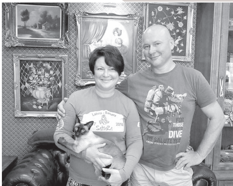
Atgriežoties no Āfrikas pekles.