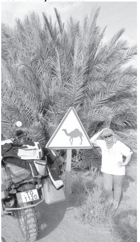
Foto par piemiņu.