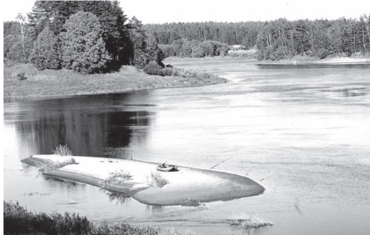
Iemīļotā vieta pie Daugavas.

Ārkārtīgi sarežģīta šī vasaras sezona šķiet tiem makšķerniekiem, kam patīk cope ar fideri. Taču mūsu redakcija saņēma pilnīgi drošas ziņas par noķertajiem trīs-četrus kilogramus smagiem plaužiem Piedrujas