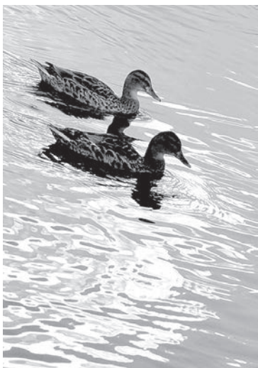
Vēl neizbiedētās meža pīles.

traucē makšķerēšanai ar fideri. Taču, kā saka, nav ļaunuma bez labuma: kad upē turpinās ūdens līmeņa paaugstināšanās, zivs pārvietojas tuvāk krastam. Un daudzi copmaņi, kas iecienījuši makšķerēšanu ar pavadiņu un piebarošānu, veiksmīgi turpina ķert ne tikai lielas raudas, bet arī plaužus. Galvenā viltība - atrast piemērotāko vietu, un sevi cenošie makšķernieki labprāt parāda savas bildes mobilajos tālruņos, tur ir redzami apskaužami eksemplāri, bet par šī objekta ģeogrāfisko atrašanās vietu viņi gan klusē kā partizāni nopratināšanas laikā.