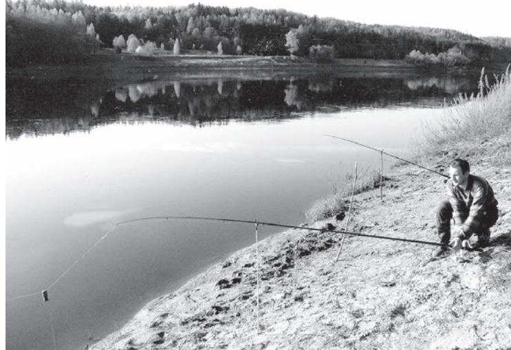
Mājīgs krasts gruntmakšķerēšanai.

Aptuveni deviņos no rīta pirmais skaistulis ar dzelteniem sāniem laimīgi nomierinājās