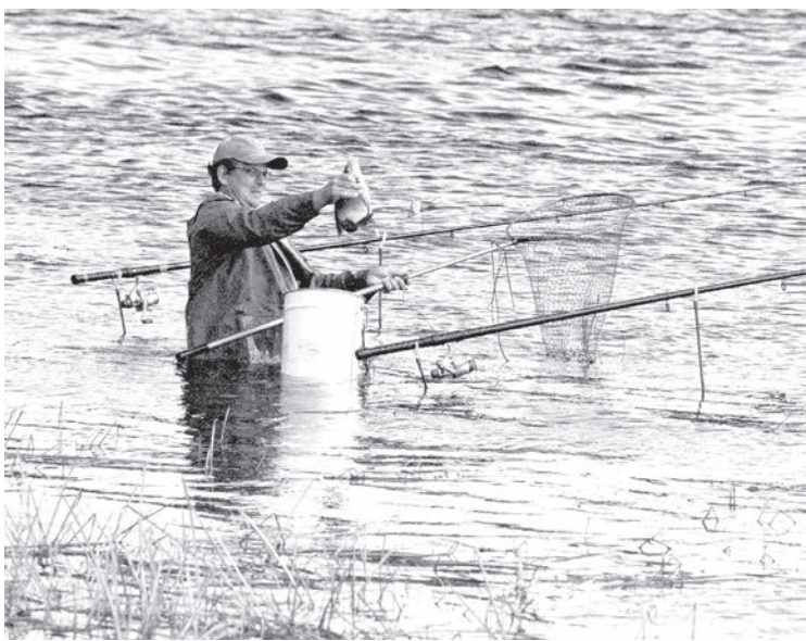
Cope ar fideri netālu no Piedrujas.

labības pļauju, taču arī tad, ja izdosies sagaidīt saulainas dienas, tīrumi, kuros ir smilšmāla augsne vai kuri atrodas zemās vietās, tik ātri neizzūs.