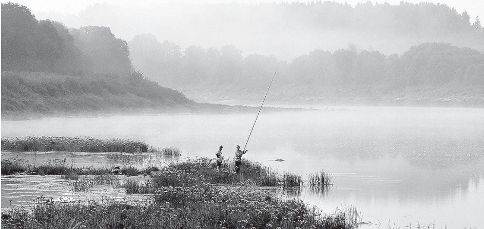
Saullēkts virs Daugavas.

Tik lietainas vasaras, šķiet, nebija nekad visa mana mūža garumā. Protams, visai bieži ir gadi, kad Līgo dienā gāž kā no spaiņiem, un tikai retajiem laimīgajiem izdodas pavadīt visu Jāņu nakti pie lielā ugunsкура. Man arī gadījies redzēt, un ne reizi vien, kā lielas siena kaudzes atspoguļojas vasaras palu ūdeņos, kas piepildījuši applūdušās pļavas. Bet lai lietus lītu gandrīz divus mēnešus pēc kārtas... Diemžēl joprojām ne visiem lauku iedzīvotājiem paveicās laikā sagatavot sienu, bet īstus fermerus izglābj siena ruļļu tehnoloģijas. Vajadzētu turpināt