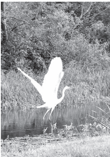
Balto gārņu kļūst arvien vairāk.

Tik lietainas vasaras, šķiet, nebija nekad visa mana mūža garumā. Protams, visai bieži ir gadi, kad Līgo dienā gāž kā no spaiņiem, un tikai retajiem laimīgajiem izdodas pavadīt visu Jāņu nakti pie lielā ugunsкура. Man arī gadījies redzēt, un ne reizi vien, kā lielas siena kaudzes atspoguļojas vasaras palu ūdeņos, kas piepildījuši applūdušās pļavas. Bet lai lietus lītu gandrīz divus mēnešus pēc kārtas... Diemžēl joprojām ne visiem lauku iedzīvotājiem paveicās laikā sagatavot sienu, bet īstus fermerus izglābj siena ruļļu tehnoloģijas. Vajadzētu turpināt