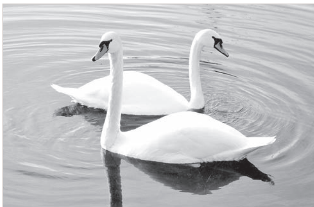
Ābeles ziedos, gulbju uzticība.