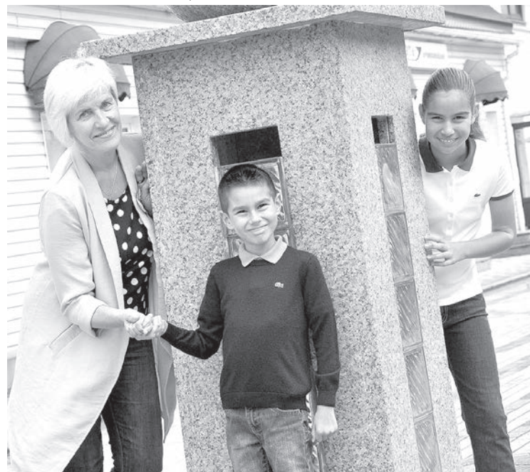
Latvijas vecmāmiņa un amerikāņu mazbērni.