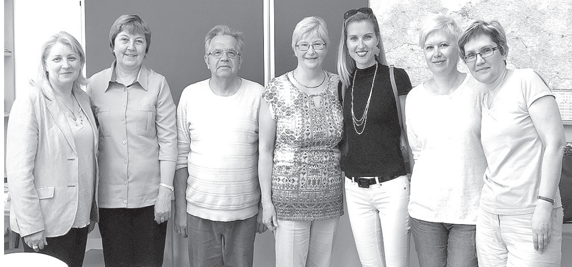
Obligātais ģimnāzijas apmeklējums.