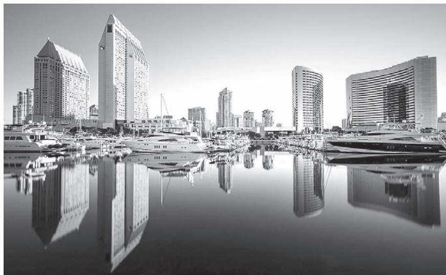
Sandjego – otrā dzimtene.