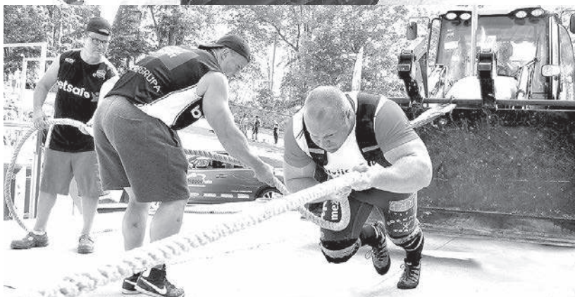
Desmit tonnas smagā traktora vilkšana