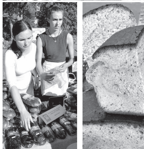
Maize jebkurai gaumei — Aglonas, Krāslavas, lietuviešu...