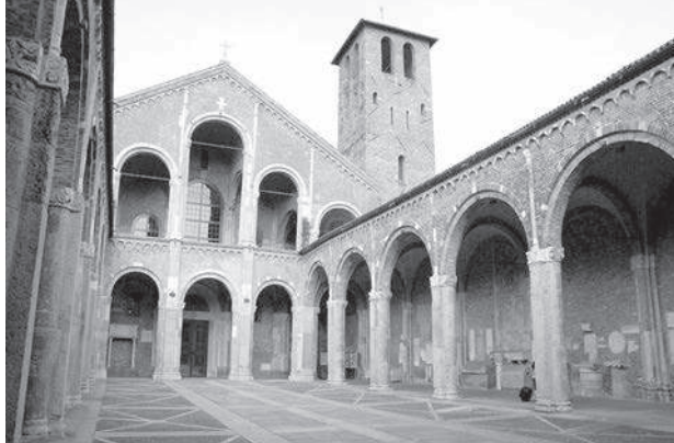
Svētā Ambrozija bazilika

Uz apvienotās Itālijas pirmā karaļa kapa ir uzraksts: "Tēvzemes tēvs". Īstenībā Viktors Emanuels daudz izmantoja izglīto un gudro ministru, kuras centās ap sevi sapulcināt dzīves garumā, darba augļus. Viņa personīgais nopelns valsts labā ir tas, ka viņš bija stingrs un konsekvents Austrijas (Itālijas neatkarības galvenā pretiniece) ienaidnieks. drošsirdīgs karavīrs un