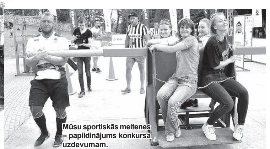
Mūsu sportiskās meitenes – papildinājums konkursa uzdevumam.