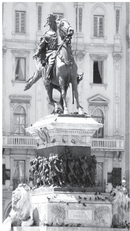
Pieminekļis Viktoram Emanuelam Otrajam

Noslēpumaina pustumsa, daudzkrāsains, cauri vitražu stikliem krītošas gaismas, askētisks altāris. Vīrs tā, tuvāk kupolam, katedrāles galvenais svētums, Dieva krusta nagla. Ik gadu Svētā Krusta pagodināšanas svētkos (14. septembrī), naglu nolaiž līdz altārim ar īpašu, mākonim līdzīgu lifta palīdzību. Pēc nostāstiem šo pacelšanas mehānismu radījis pats Leonardo da Vinči. Fotografēšana katedrāles iekšpusē nav atļauta, taču