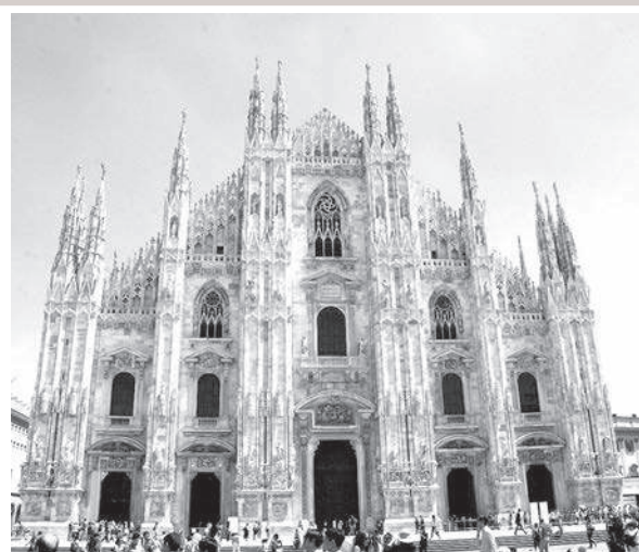
II Duomo (Milānas brīnums)

Zīja cīņai ar ariānisma ķecerību. Nebija viegli, ķecerus atbalstīja romiešu pasaulīgā vara. Savam mācītājam palīdzēja parastie draudzes locekļi: nepieciešamības gadījumā viņi sargāja Ambrozija māju, baznīcas. Imperators un viņa māte vienlaicīgi gan piekāpās, gan sūtīja ariāniešiem palīgā karavīrus dievnamu ieņemšanai. Kad situācija kļuva neciešama, Milānas bīskapsam parādījās vīzija: viņam atvērās svēto mocekļu Gervāsija un Protāsija, kuriem tika nocirstas galvas mūsu ēras I gadsimtā par atteikšanos atgriezties kristietībā, apbedīšanas vietas. Bīskapa norādītajā vietā tika atrasti svēto mūžīgie pišļi. Brīnumainas izdziedināšanas sākās laikā, kad atrastās relikvijas tika pārnestas uz tuvējo baznīcu. Notikums kļuva par īstas ticības patieso triumfu, kas lika imperatoram un viņa mātei uz visiem laikiem atteikties no ķeceru atbalstīšanas un atgriezties patiesās Baznīcas klēpī.