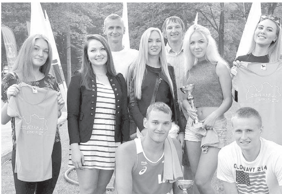
Svētku turnīru uzvarētāji - basketbolisti un volejbolisti - un svētku goda viesis Jānis Timma - starptautiski atzīts basketbolists.