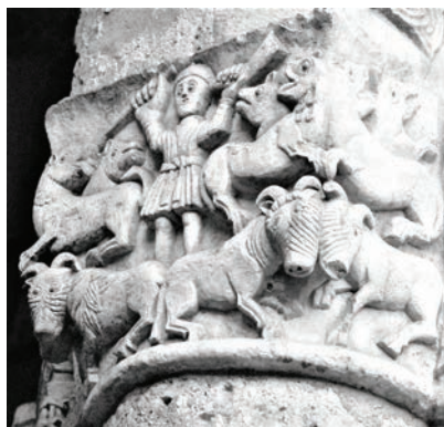
Agro viduslaiku akmens griezumā

Divi jauni cilvēki, pēc visa spriežot – brāļi (jaunākajam 12, vecākajam ap 16), Tuvo Austrumu ārienes, apsēdās pie viena no galdīņiem. Visdrīzāk vecāki aizsūtīja savas atvasas atpūsties pēc ilgas un nogurdinošas iepirkšanās (Prado, Cavalli, Louiss Vuitton utt.), paši turpinādami masveida šoppingu. Jaunie klienti radīja neizpratni pienākušajam viesmīlim – viņi pasūtīja hamburgerus. Viesmīlis saņēmās (ir jāzina, cik ļoti itāļi lepojas ar savu pasaulslaveno virtuvi un kāda ir viņu attieksme pret fast food) un ļoti pieklājīgi paziņoja, ka restorāna ēdienkartē hamburgeru nav. Tagad brīnījās jaunie apmeklētāji: "Kā nav? Vispār nav? Un ko tad ēst?" Priekšlikums pagāršot picu, pastu, lazanju, polentu, ravioli sajūsmu neizraisīja. Sekoja nikrīgā pāriša nākamais jautājums: "Vai kaut kas normāls jums ir?" Tikai viens Svētais Antonijs zina, cik pūļi bija jāpieliek viesmīlim, lai ārēji izskatītos mierīgi un pieklājīgi. Viņš piedāvāja jaunajiem cilvēkiem frī kartupeļus un kolu. Austrumu bērni piekrita nelabprāt, nopakaļ saukdami: "Arī kečupu, lūdzu!" Viesmīlis ātri aizsteidzās uz virtuvi... Drīz vien uz neparasto klientu galda parādījās liels šķīvis ar frī kartupeļiem, divas kolas pudeles un liela plastikāta pudele ar kečupu. Pārējie restorāna apmeklētāji ar interesi sekoja tam, kā Milānas labākajā picērijā divi jauni cilvēki ar apetīti notiesā frī kartupeļus ar kečupu un uzdzēr kolu. Iestādes personāls klusi cieta, pārdzīvodams apvainojumu par savu