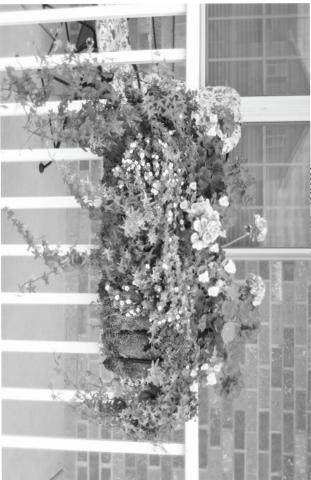
runāt ar puķi veicot vakara kopšanas-

Ziemas laikā var būt nepieciešamība pēc ūdens un barības vielām. Karstākajos ziemas mēnešos nepieciešams neliels noēnoļums. Piemēroti ziemeļu un austrumu puses palodzēm.