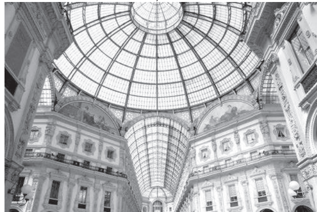
Senākā Eiropas pasāža – Viktora Emanuela galerija

Tikko esi ienācis vienā no Milānas senākās baznīcas vārtiem, tā uzreiz nokļūsti agrajos viduslaikos. Ceļveži vēsta, ka bazilika ir vairākas