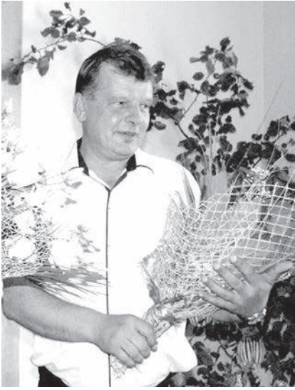
Turpinājums. Sākums 3. lpp.

Auni novērtē īpatnējas smaržas, viņu dārzā vieta atradīsies sinepēm, rozmarīnam, ķiplokiem un apiņiem.