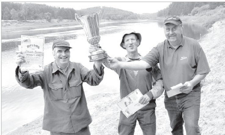
Триумфаторы из города Прейли.

над нами пролетел с криком большой клин лебедей. В разгар лета, не может быть!.. Вот уж действительно — дар свыше! Рыбалка — языческое поклонение зорям.