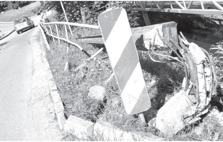
Краслава: старая проблема.