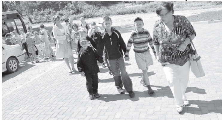
Экскурсанты из Шкяуне.