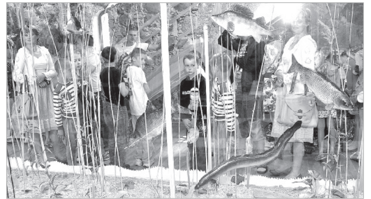
Волшебное подводное царство.

отходы, оставленные несознательными людьми. Вот такой урок впрок.