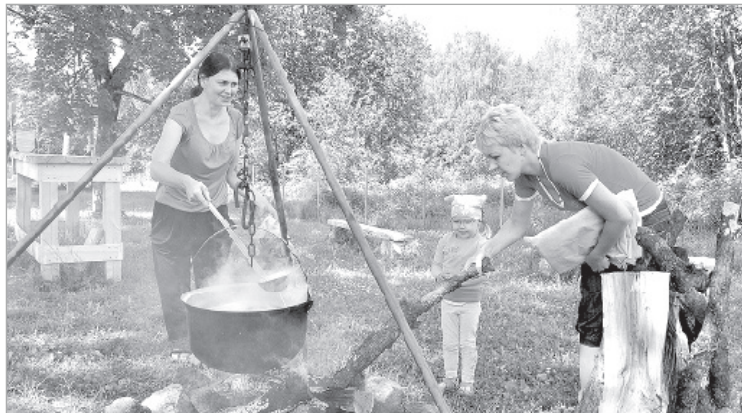
Уха — пальчики оближешь...