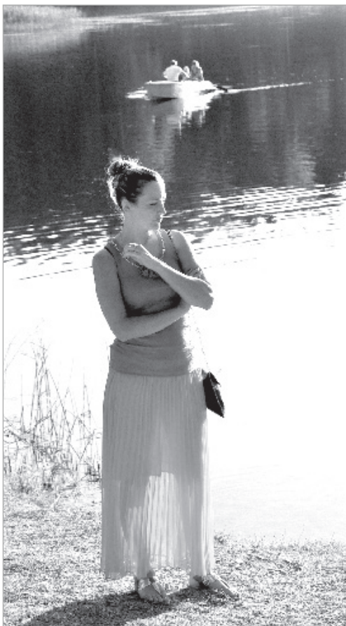
На озерном берегу.