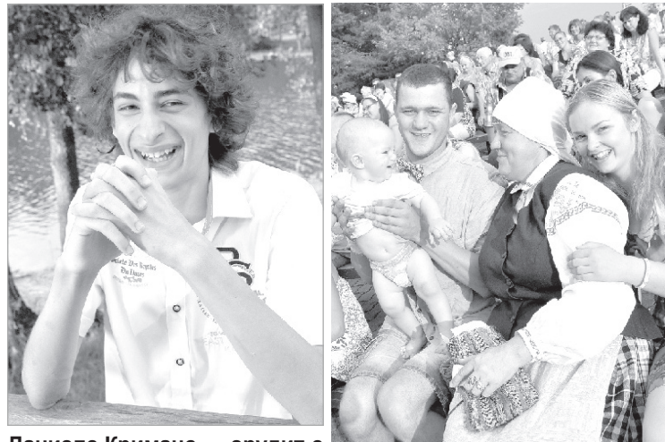
Даниэлс Криманс — эрудит с мировым признанием.