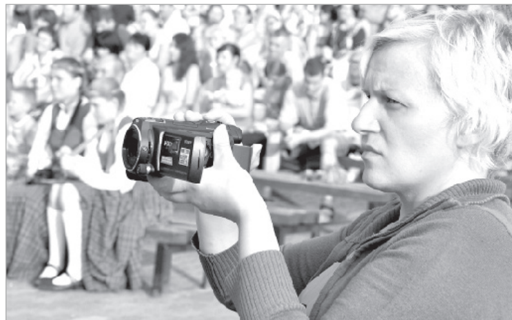
В кадре — исторические сюжеты.