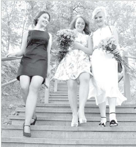
Вчера — гимназисты, сегодня — студенты.