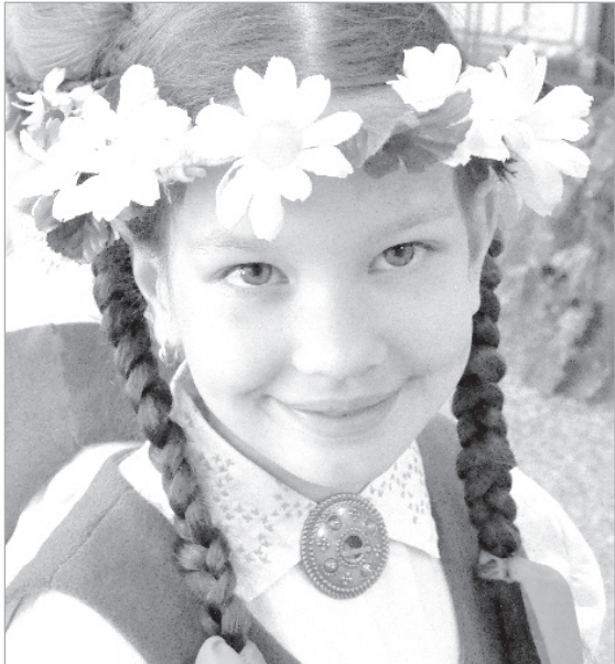
Школа — мир творчества.