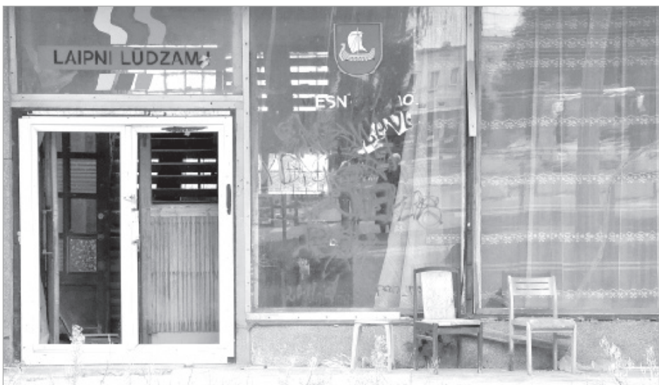
Незамеченная презентация ресторана «Ночная Краслава». Поиск саморазвлечений молодежи продолжается...