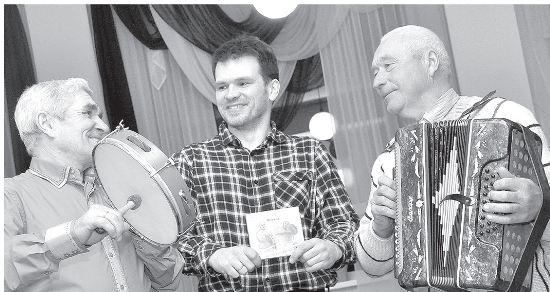
Украшение праздника влюбленных в Дагде — презентация диска «Bubyns».