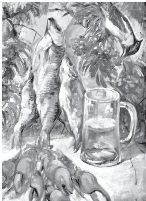
Натюрморт кисти художника Е. Ильинца.