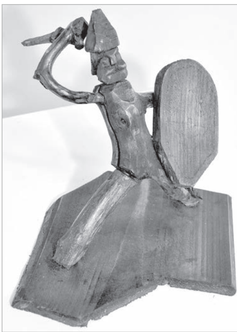
Почерк скульптора по дереву.