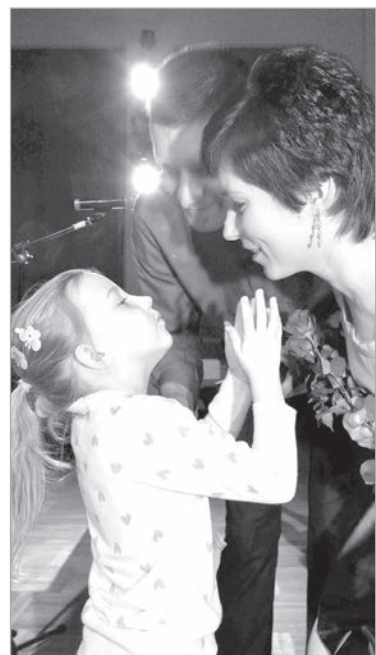
Поздравление — как в ЗАГСе.