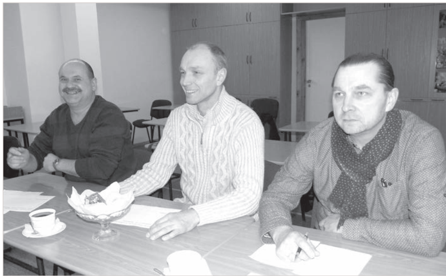
Работает жюри, идет просмотр.