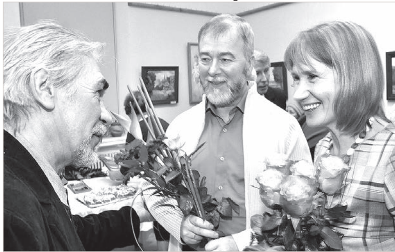
Мастер и муза принимают поздравления.