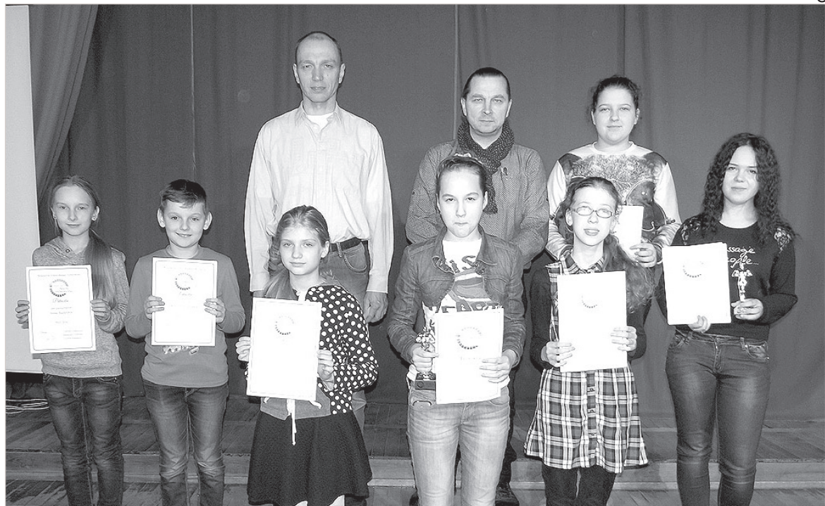
Участники и члены жюри после вручения призов.