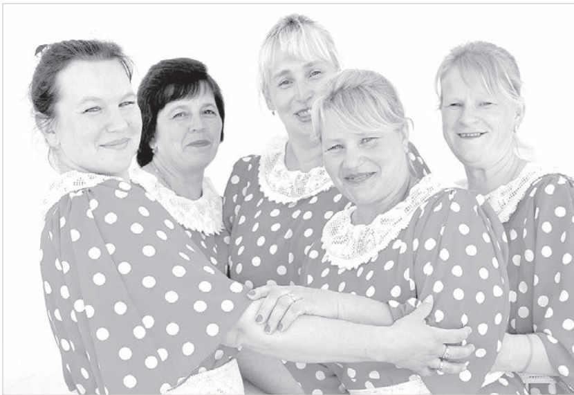
С подружками по сценическому увлечению.