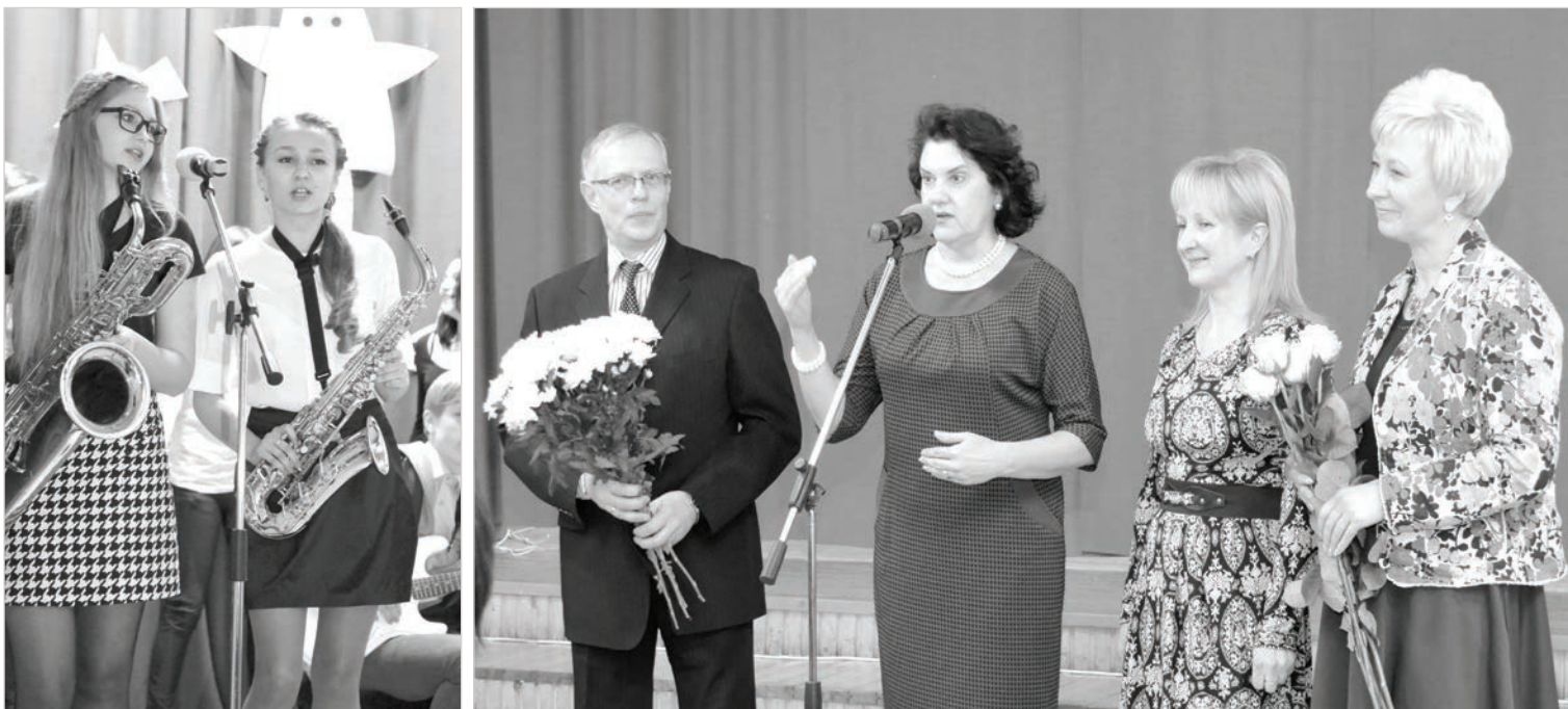
Продолжение темы — на стр. 4-5.