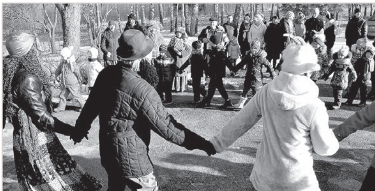
Отзвуки веселой Масленицы: Удриши, Извалта, Скайста, Комбули, Науене...