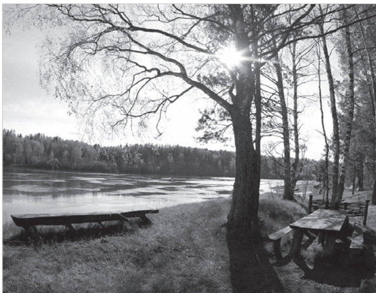
На пороге — весна!