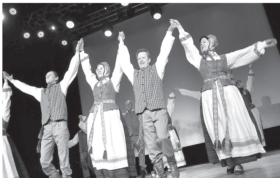
Хозяева международного фестиваля.