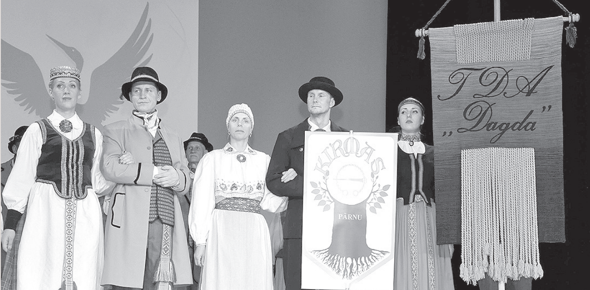
Открытие фестиваля «Gerve 2016».