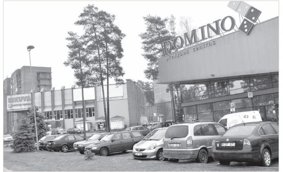
Один из уголков самого молодого города республики.

ников, символизирующую мир творчества. Ничто так не объединяет народы, как искусство и особенно танцы, понятные зрителям без переводчиков. Нашу делегацию литовцы встречали как старых знакомых: договор о сотрудничестве подписан полтора года назад, и за каждым культурным десантом непременно следует продолжение: планы сотруд-