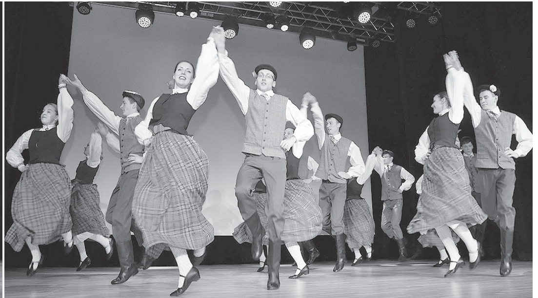
Визитная карточка Дагды.