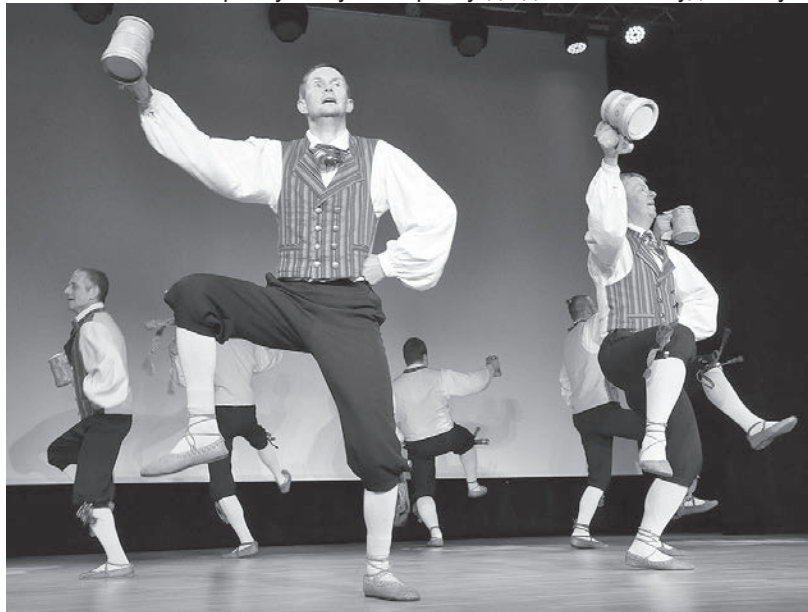
Гвоздь эстонской программы.