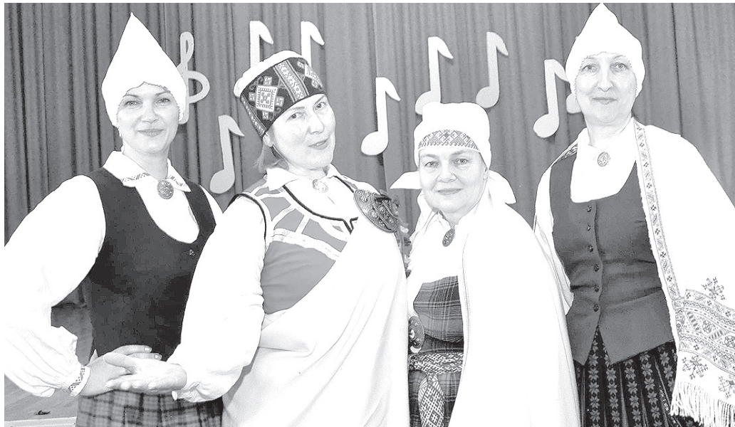
В следующем номере — концерт-посвящение творчеству Раймонда Паулса. Репортаж из Краславской основной школы.