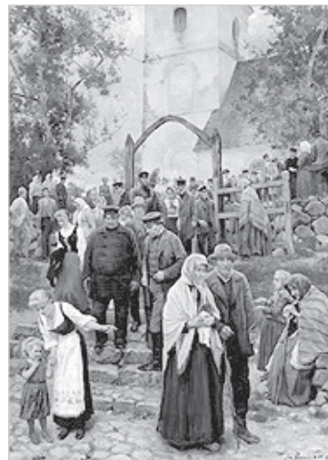
«После богослужения» («Из церкви», 1894).

страны он признан одной из центральных личностей и одним из основателей латышского профессионального искусства. В свою многостороннюю деятельность он внес новые принципы, связанные с тенденциями эпохи — как в бытовом жанре, так и в портретном, в мифологической и в религиозной живописи, в декоративной и прикладной графике Розенталс использовал разные концепции искусства того времени, которые в 1900-е годы появились в Латвии как инновации.