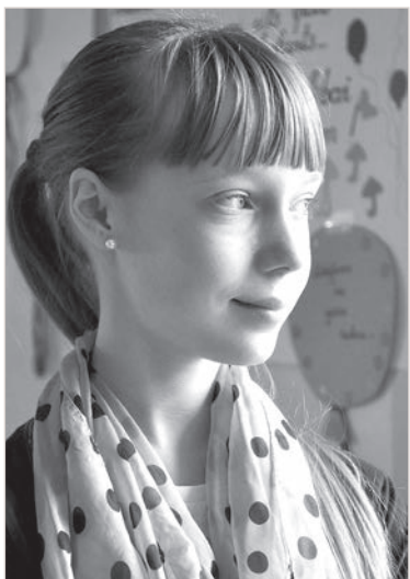
«Мечтаю о театре»

Талантами не рождаются, а в юном возрасте, как правило, это результат увлеченности, целеустремленности и трудолюбия. В Краславской основной школе «Эзерземе» предложили две новости: не простые — сенсационные.