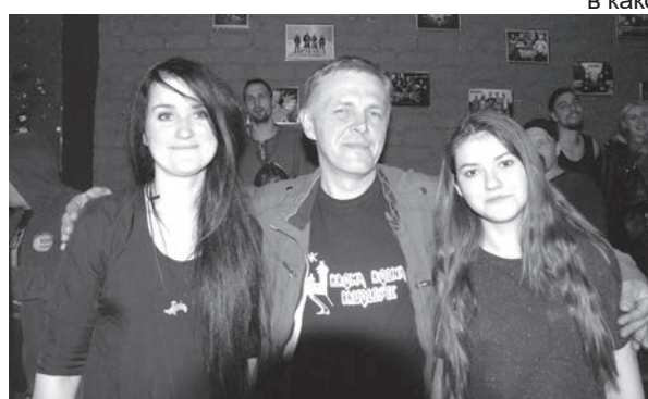
«Вождь» с финалистами Эвией и Джесикой.

За музыкальное сопровождение мероприятия в перерывах между сражениями отвечали представители тяжелой музыки — исполняющие фолк-металл «Symbolic», объединение симфонического металла