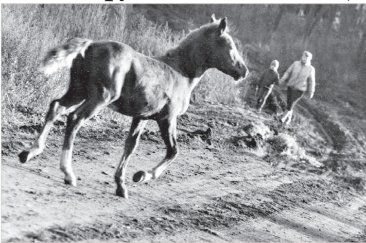
Картинка из далекого детства.