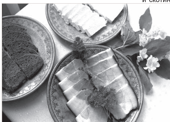
Деревенская еда — деликатес для городских гостей.