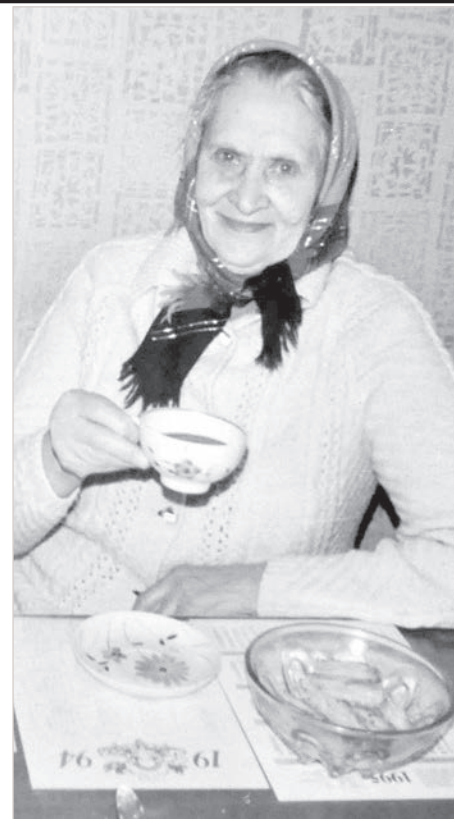
В гостях у сестры-рижанки.