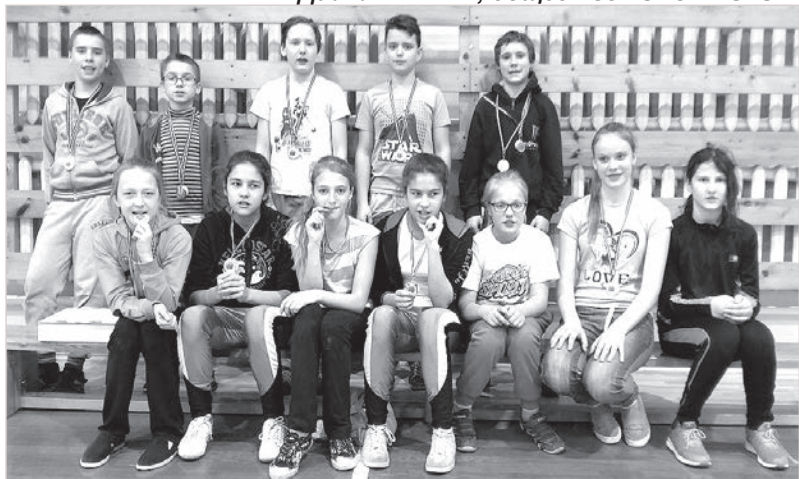
Команда Извалтской основной школы.