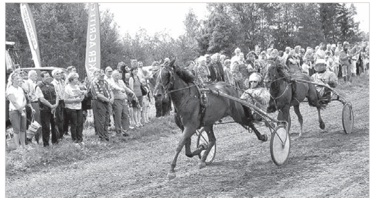
Дни Анны в Дагде.