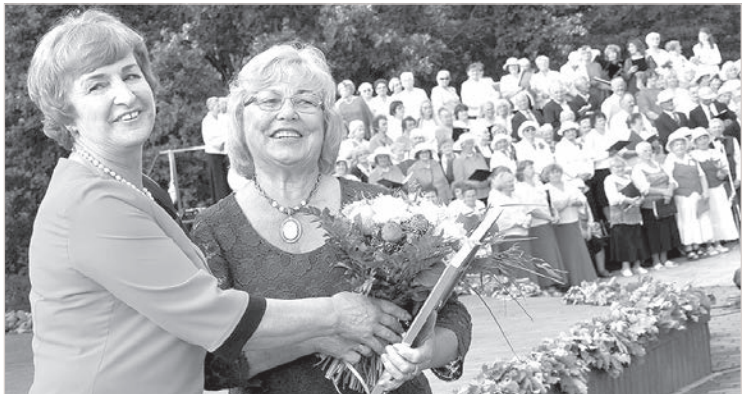
Аглона. Фестиваль сениоров Латгалии.