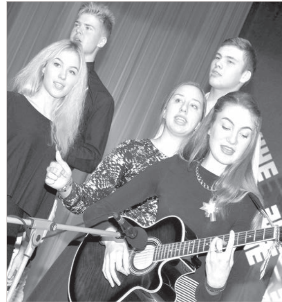
Песни о родине.