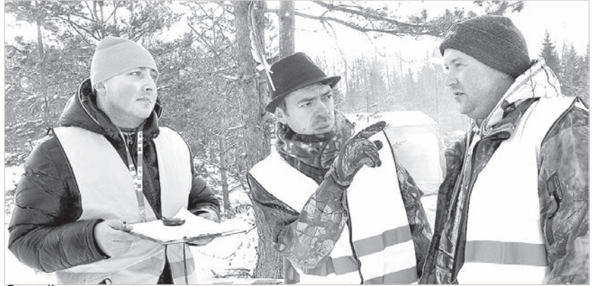
Судейство – на высшем уровне.