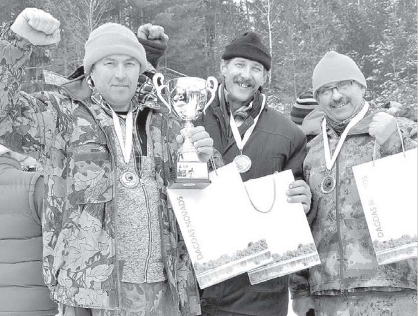
Андзельские охотники – обладатели бронзы.