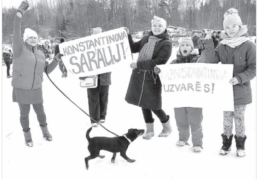
Поддержка болельщиков – половина успеха.