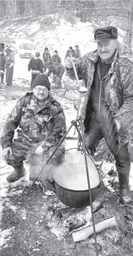
Андруппенский ресторан «Pi Jona».