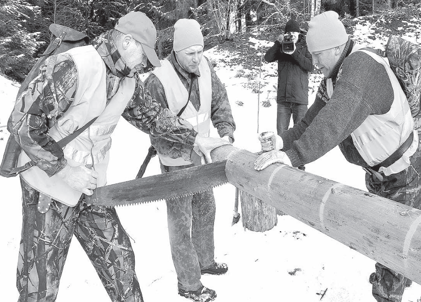
Мастерский почерк Асуны.