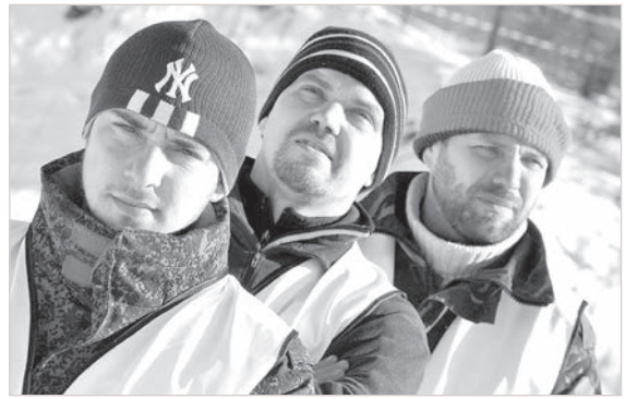
Константиново – настрой только на победу.