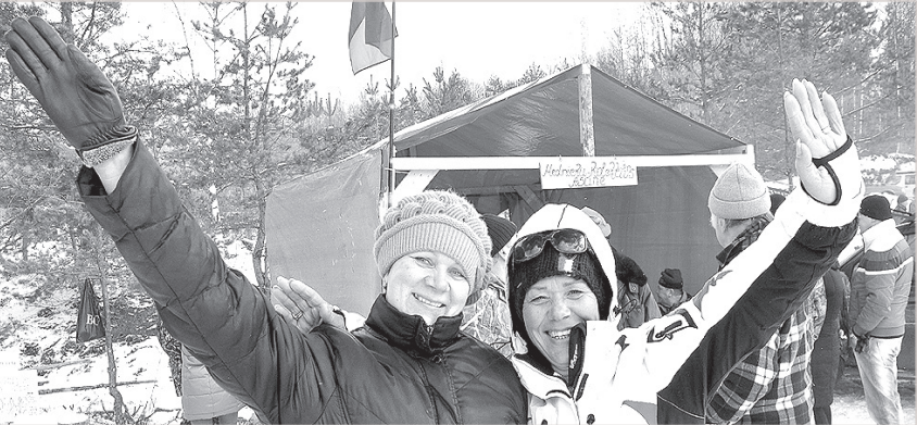
Азартные жены охотников.