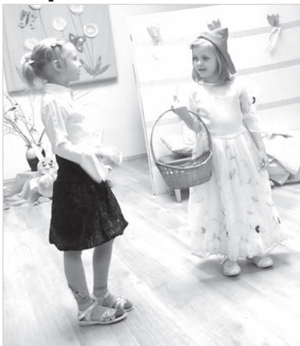
В начале апреля, 4-го числа, в нашей школе гостили сказочные герои: добрая Красная Шапочка со своими

друзьями – Бабушкой, Петухом, Собачкой, яркими Бабочками и Охотниками. Кроме того, школу посетил хитрый Волк.