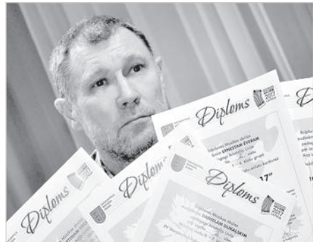
Пять дипломов международного конкурса «Naujēne 2017».