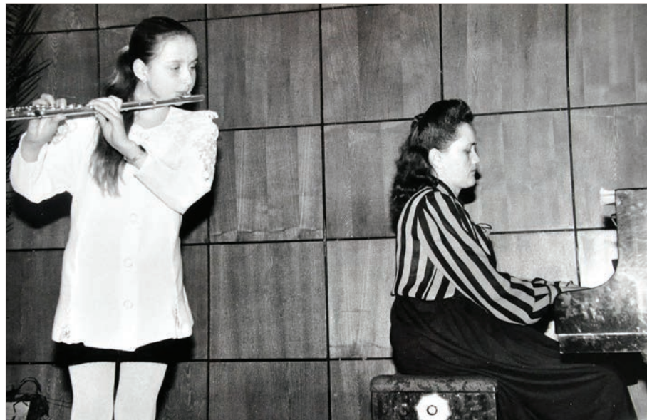
Начало педагогической карьеры.