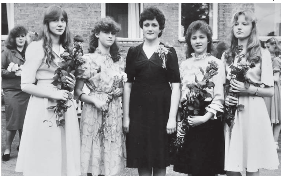
С первыми выпускниками.