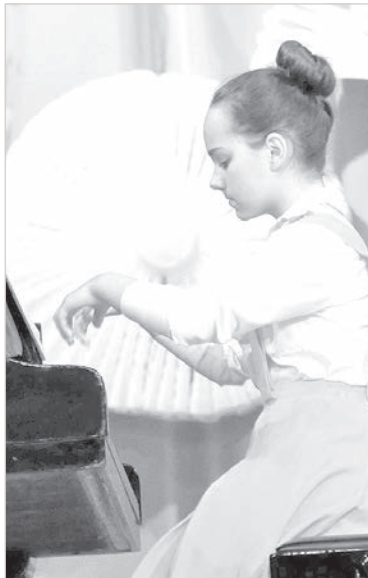
Пианистка Агате Паулиня.