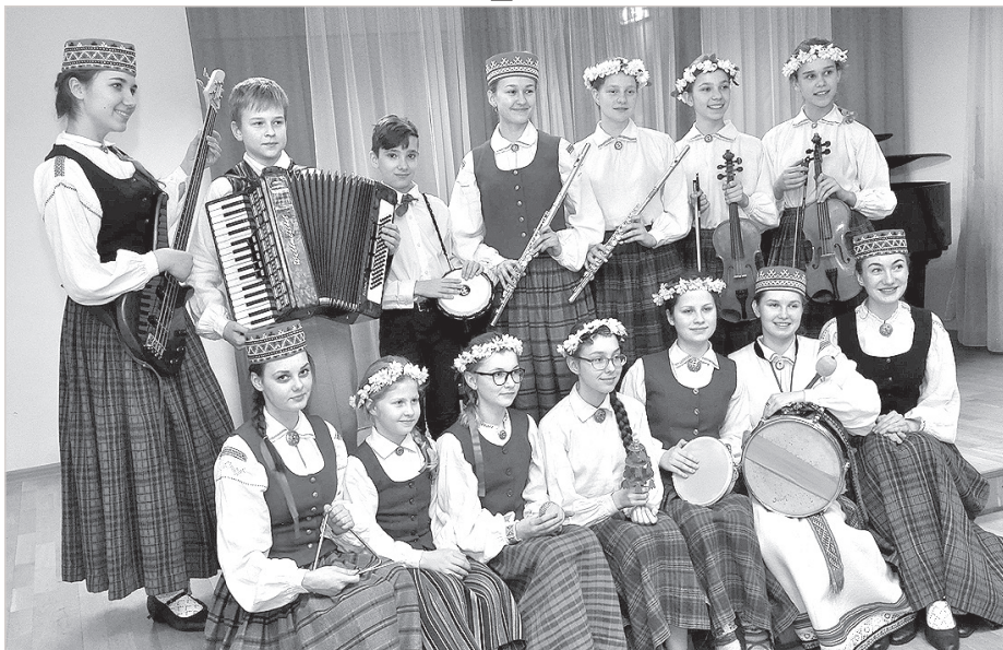
Вновь созданный оркестр народных инструментов.