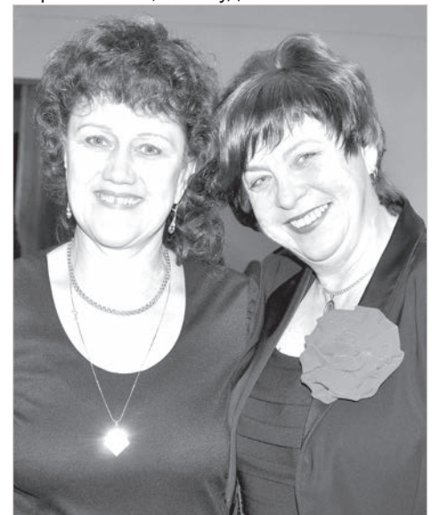
Дружба длиною в жизнь.