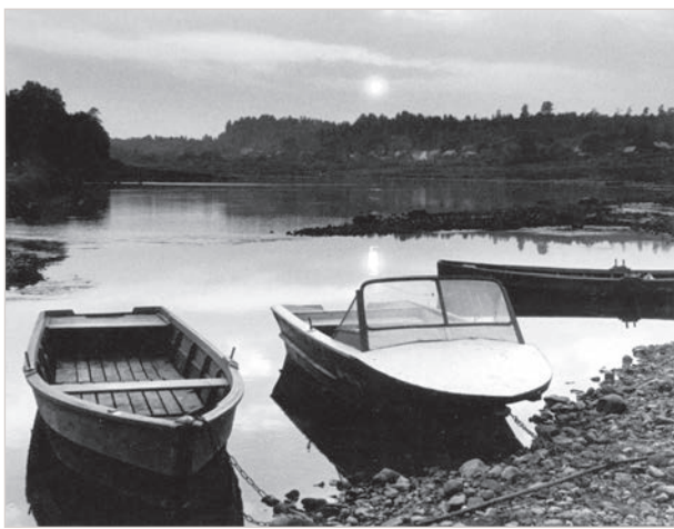
Вид из окна родительского дома.